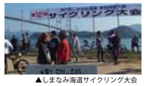
▲しまなみ海道サイクリング大会