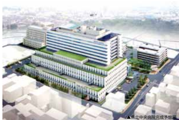
▲県立中央病院完成予想図

加えて、個室や駐車場、エレベーターが増えるとともに、敷地内の緑化が進められます。平成二十六年の完成まで、しばらくお待ちください。