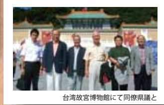
▲台湾故宮博物館にて同僚県議と