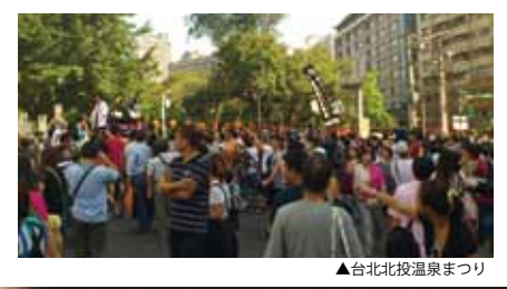
▲台北北投温泉まつり