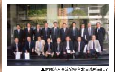
▲財団法人交流協会台北事務所前にて