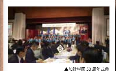
▲加計学園 50周年式典