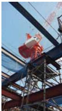
▲県立中央病院建替え現場

新病院は「県民の安心の拠り所となる病院」をめざし、全県をカバーする高度救急医療を提供。現在分散されている救急センターと墓誌医療センターを集約し、さらに機能充実が図られます。また、ガンや脳卒中、心筋梗塞などに対応しうる先進医療・高度専門医療の質の向上が図られ、災害基幹拠点病院としての機能が強化されます。