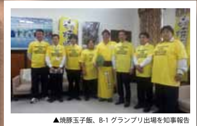
▲焼豚玉子飯、B-1 グランプリ出場を知事報告