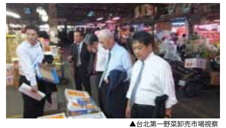
▲台北第一野菜卸売市場視察