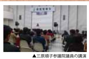
▲三原順子参議院議員の講演