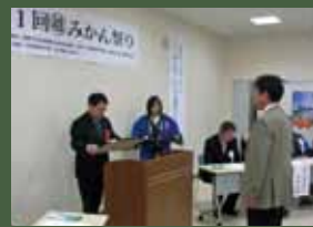
▲東予農業共済組合表彰