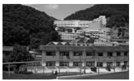
▲吉備国際大学視察