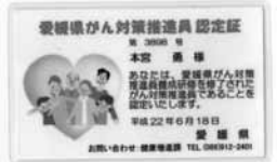
▲愛媛県がん対策委員認定書