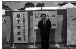
▲子ども療育センター起工式