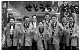
▲愛媛県アンテナショップ視察