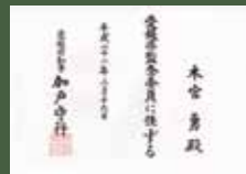
▲愛媛県監査委員任命書

愛媛県の自治行政をさまざまな観点からチェックし、税金が正しく使われているか、それぞれの事業が本来の効果を上げているかなどを監査します。