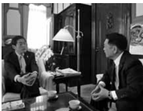
▲中村愛媛県知事と