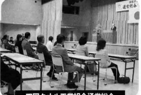
四国タオル工業組合通常総会

5月11日四国4県県議会議員軟式野球大会が香川県営野球場で開催され、愛媛県が昨年に引き続き優勝しました。私は生まれて初めて投手を経験。練習の時のようにストライクが入らず…苦戦しました。(愛媛県議会にはプロからも声がかかったほどのエースがいますが、その人が投げると他県チームでは打てないため、私が投げた次第です)この大会で私が最高殊勲選手に選ばれましたが、「MVP」ではなく「M愛P」だからかわれました。