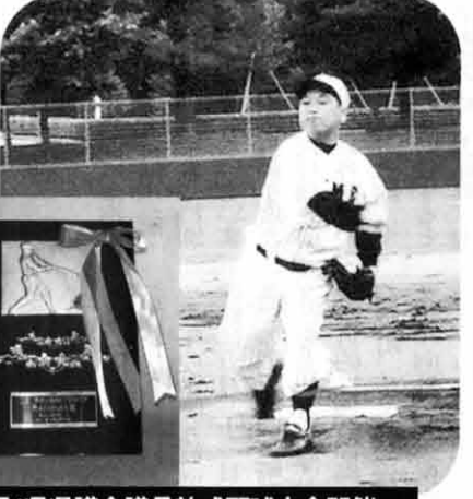
四国4県県議会議員軟式野球大会開催

5月17日野間馬保存会の総会がのま馬ハイランドであり出席。そのあと新しく誕生した馬の命名式もありました。