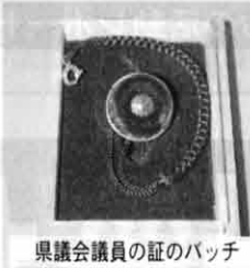
県議会議員の証のバッジ

全国47都道府県議会議員は、平成13年7月1日現在、条例定数で2910人、現議員数は2858人で欠員52人となっています。男女別では、男性が2697人、女性が161人となっています。女性議員が少ないのは山形と広島のみで、政党内では、自民党が1166人、民主党が115人、公明党が112人、共産党116人、社会民主主義66人、自由党2人、無所属199人となっています。諸派ならびに北海道、大阪府など12道府県については把握出来ていません。年齢別では、30歳未満6人、30から40歳未満118人、40から50歳未満458人、50から60歳未満1164人、60から65歳未満497人、65から70歳未満23人、70から80歳未満277人、80から90歳未満14人、90歳以上は1人となっています。全議員の平均年齢は、57.5歳。愛媛県は全国平均より少し若い56歳で、平均年齢が一番低いのは東京都の52歳、最高齢の県は青森県の62.3歳となっています。当選回数別も1期から14期まで広がり、順に725人、656人、551人、347人、232人、153人、107人、43人、24人、13人、3人、2人、1人、1人となっています。