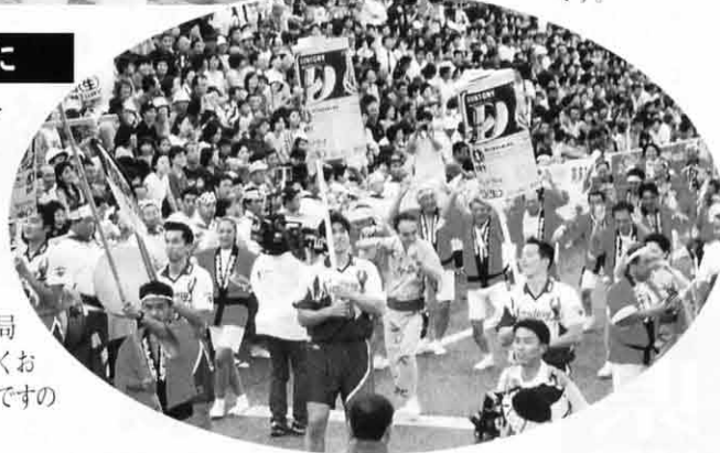
阿波踊りツアーで徳島に

市議時代はダンスバりに「ザ・市議ナース」で参加していました。県議になってから初めての参加、来年からも見学でなく踊りで参加するつもりです。