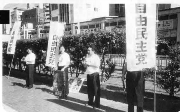
自民党県連青年部が街頭演説

私の守備はショートです。年1回各県持ち回りで開催しているもので、前日の夜には自費参加の懇親会もあり他県の議員と交流を深めるのにいいチャンスです。