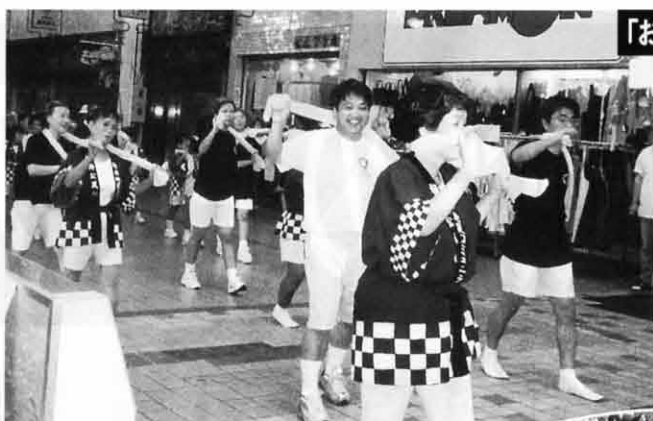
「おんまぐ」桜井校区踊り連に参加