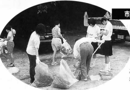
市民大清掃に子供と参加

あ!そうそう、ほんのチョッピリ自己紹介、私は今治のことを、うらやましく思ってる、とある新居浜の年男であります。でも新居浜もがんばらなくちゃ!!本宮さんのような、ものすごく誠実さを感じる政治家の方にはどんどん大きくなってもらいたいですね。新居浜からもどんどん応援します。それではまた。 http://www.shiraishi.gr.jp/