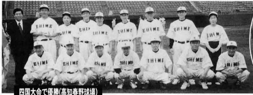
四国大会で優勝(高知春野球場)