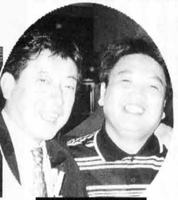
塩崎代議士と(松山で)