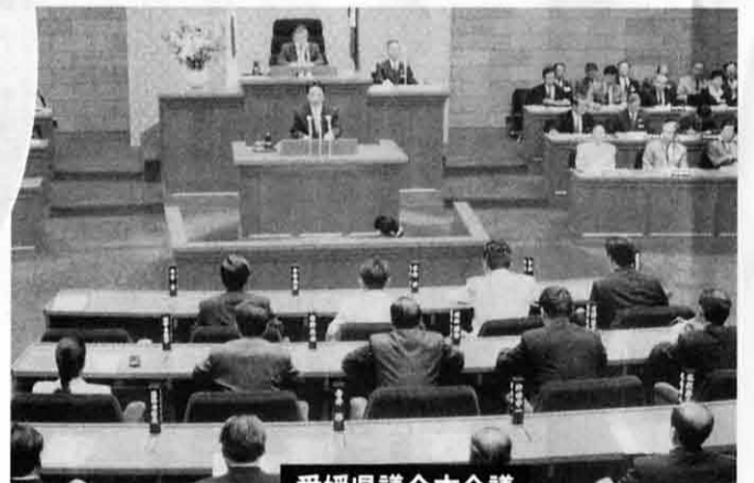
愛媛県議会本会議