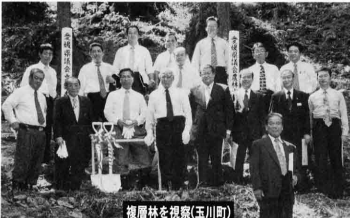
複層林を視察(玉川町)