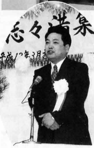
志々満集会所が落成