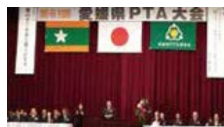
愛媛県PTA大会で挨拶しました