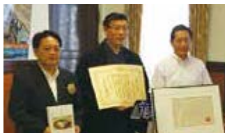
愛顔のえひめの知事表彰式に同席