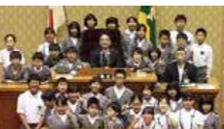
近見小学校児童の県議会体験会