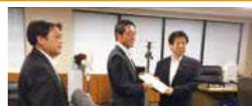
塩崎厚生労働大臣に県の重要施策を要望