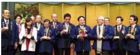
愛媛県年賀交歓会に出席して、挨拶