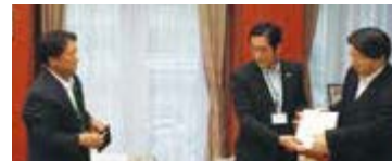
林農林水産大臣に県の重要施策を要望