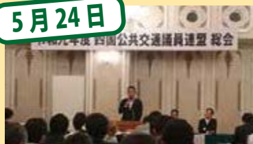
四国公共交通議員連盟