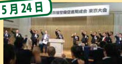
第3回四国新幹線整備促進期成会東京大会

8月22日は、東京で行われた四国新幹線整備促進期成会に公共交通活性化促進議連会長として出席しました。この回では一日も早い四国新幹線の実現を図ろうという決議が採択されました。