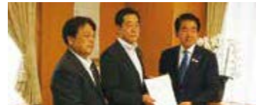
下村文部科学大臣に県の重要施策を要望