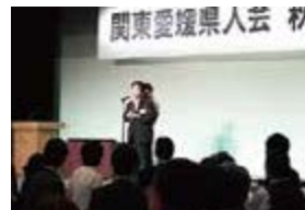
関東愛媛県人会で挨拶