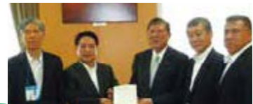
四国4県議長として国に要望しました