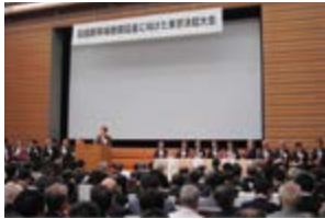
▲四国公共交通議員連盟会長として挨拶