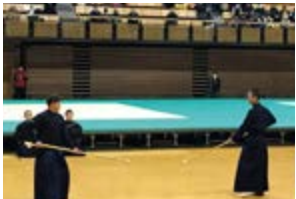
▲愛媛県銃剣道連盟鏡開き式

6 期目を迎え、県議会の委員会では「経済企業委員会」の副委員長と「議会運営委員会」の委員を努めさせていただきます。