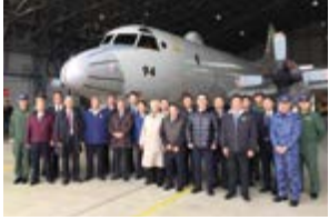
▲航空自衛隊基地を視察